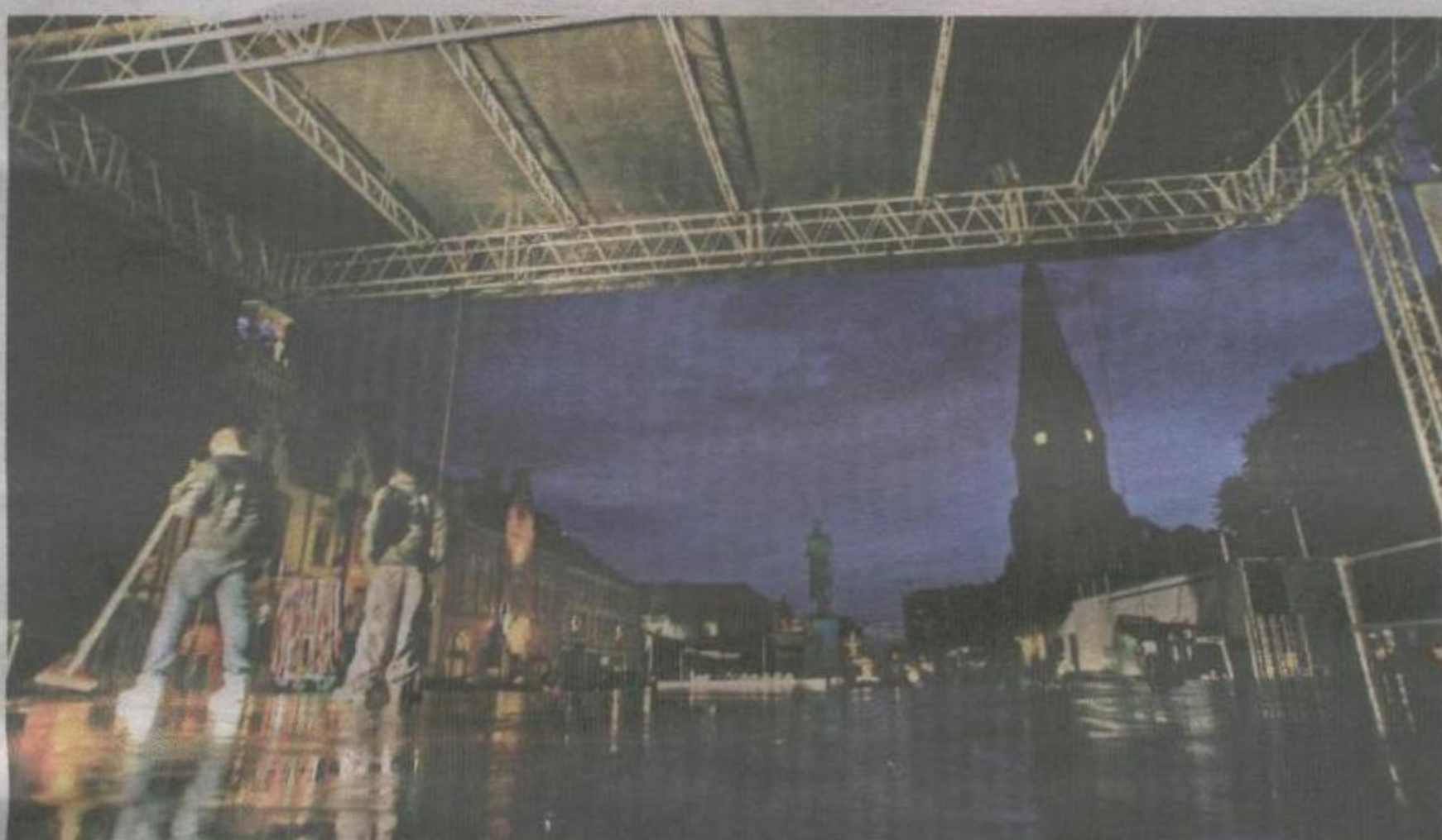
KLARNER OPP: I går kveld trakk skyene til side, og riggerne kunne sope bort vannet fra scenen på Øvre Torv.